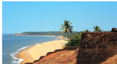
Бекальский пляж с фортом

Форт Хосдург (15 км от Бекала), построенный в 19 веке, производит впечатление своими круглыми бастиями. Это место известно международно признанным духовным центром с 45 пещерами — Нитхьянадаграм.