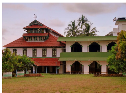
Мечеть Малика Динара