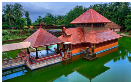
Храм Анатхапура на озере